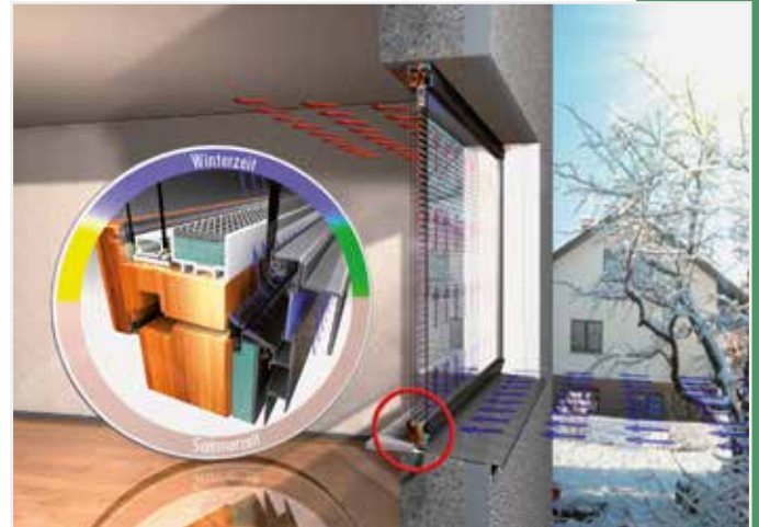
gemäßigte bis kühle Klimazone: Energiegewinnung durch Vorwärmen der von außen kommenden Frischluft