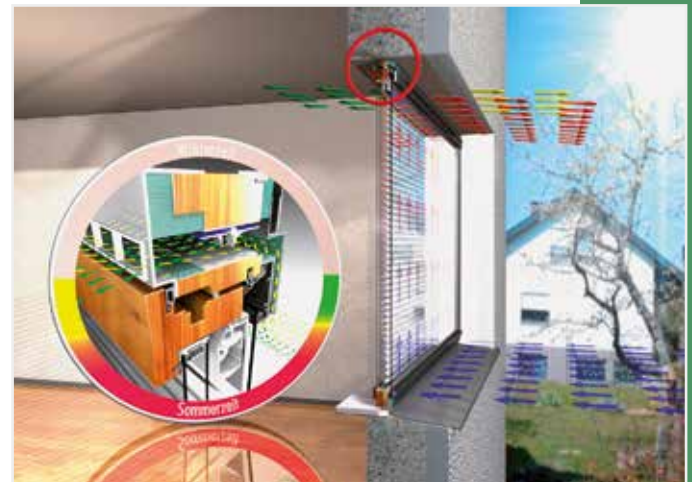
warme und heiße Klimazone: Tageslichteinfall ohne Wärmeeintrag